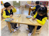
마스크를 벗고, 가림 판을 하고 난 후에 친구의 얼굴을 관찰하고 그림으로 표현해 봅니다.

내가 좋아하는 친구의 얼굴을 그림으로 표현해보며 나와는 다른 얼굴이지만 친구라는 것을 알게 되었습니다.