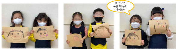
친구의 얼굴을 관찰한 아이들이 친구의 머리카락 모양, 눈썹, 눈 코, 입 등을 표현하고 난 후, 친구에게 자신의 그림을 소개하며 이야기를 나눕니다.