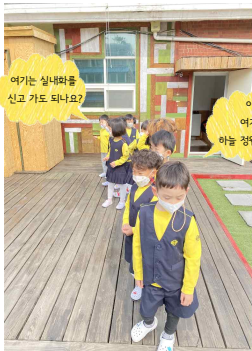
지하1층부터 4층 하늘정원까지 둘러보았어요.

동생반과 형님반은 어디에 있는지, 또 유치원 건물 안에는 어떤 곳이 있는지 궁금한 친구들은 지하1층에서 4층 하늘정원까지 둘러보며 유치원 곳곳에 대해 알아보고, 튼튼유치원의 상징에 대해서도 알아보았습니다. 그리고 나만의 유치원으로 새롭게 만들었어요!