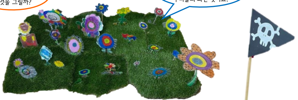
오래된 보물지도가 숨겨져 있는 곳! 우리들의 화단 멋지죠?

뮤지컬 공연을 위해 필요한 소품 중에서 릴리의 지도와 보물지도, 해적 친구들이 여행을 떠날 때 맬 가방과 보물지도가 숨겨져 있는 화단이 필요하다고 하여 어떻게 만들지 정하여 만들어보았습니다.