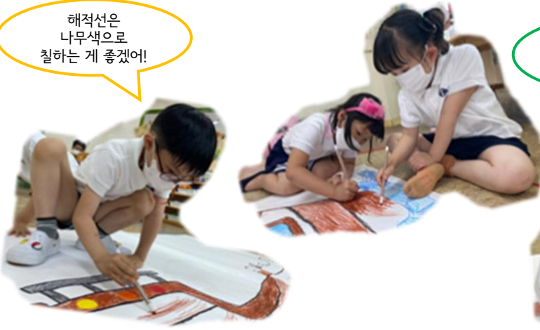
해적선은 나무색으로 칠하는 게 좋겠어!

뮤지컬 공연을 위해 필요한 소품 중에서 릴리의 지도와 보물지도, 해적 친구들이 여행을 떠날 때 맬 가방과 보물지도가 숨겨져 있는 화단이 필요하다고 하여 어떻게 만들지 정하여 만들어보았습니다.