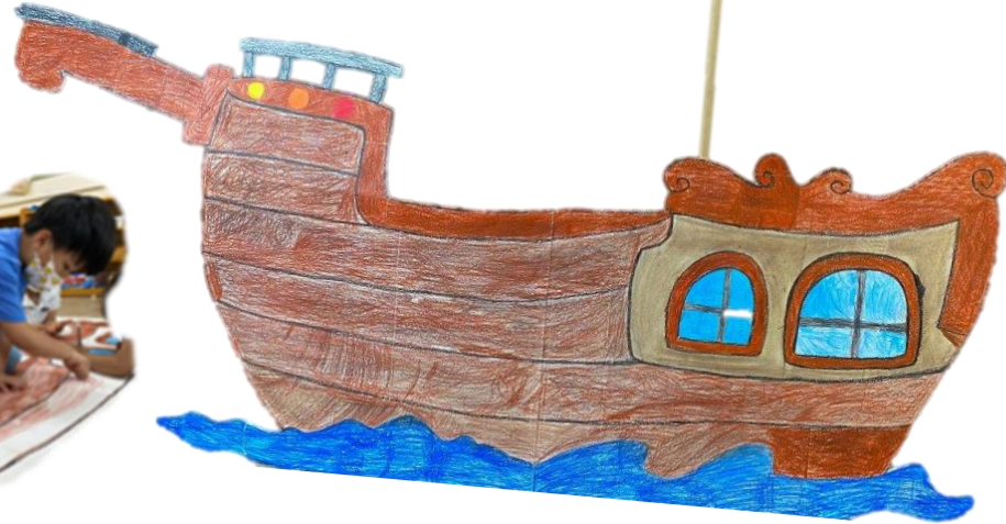
나무의 나이트에 모양도 그려 줄래!