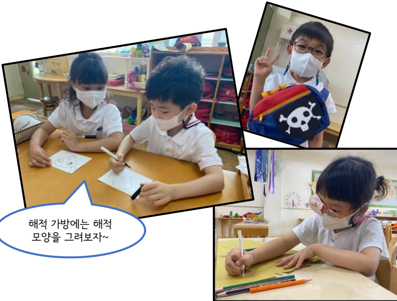
해적 가방에는 해적 모양을 그려보자~